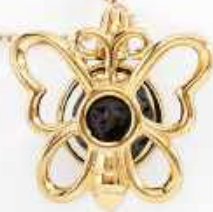
*NB2801 Dije para esencias / Aromatherapy necklace 42 cm + 10 cm ext. / 16 1/2" + 4" ext. 🇮🇹 449 - 🇺🇸 37