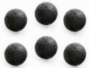
*NB2805 Set 6 pzs. p/esencias / Aromatherapy Set 🇮🇹 69 - 🇺🇸 7

Una forma simple de usar tus aceites esenciales. Agrega unas gotas de tu aceite favorito a las piedras y disfruta durante todo el día. / A fantastic way to bring more aromatherapy into your day! Add a few drops of your favorite essential oil on the stone beads and enjoy.