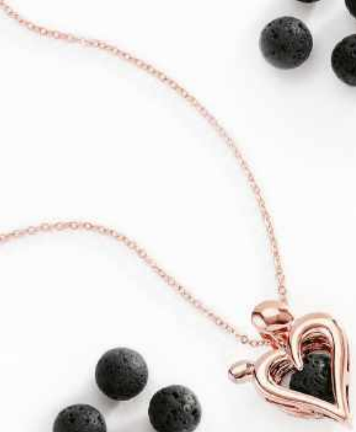
*NB2802 Dije para esencias / Aromatherapy necklace 42 cm + 10 cm ext. / 16 1/2" + 4" ext. 🇮🇹 499 - 🇺🇸 42